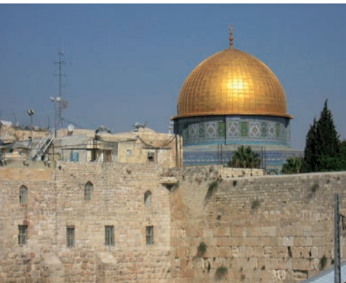
Jérusalem. Le Mur des Lamentations et le Dôme du rocher à Jérusalem, ville sainte pour les trois religions monothéistes, judaïsme, christianisme et islam.