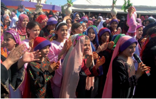
Khan Younés, bande de Gaza , octobre 2012. Spectacle des enfants lors du festival fêtant les 20 ans de l'association Culture et Pensée Libre.