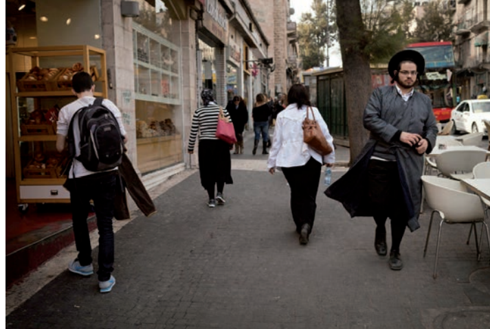
Jérusalem-Ouest. Une rue passante, novembre 2012.

L a population juive israélienne se compose de deux traditions culturelles principales. Les ashkénazes, dont est encore souvent issue l'élite politique israélienne, sont d'origine européenne. Leur immigration vers la Palestine, animée par le projet politique sioniste d'y créer un État juif, a commencé dès la fin du XIX e siècle. Elle s'accélère dans les années vingt dans un contexte où l'antisémitisme grandit en Europe. Décimés par la Shoah pendant la Seconde Guerre mondiale, les survivants tentent de se réfugier en Palestine alors sous mandat britannique, puis affluent massivement dans les années cinquante après la création de l'État d'Israël, en 1948. L'autre grande tradition culturelle concerne les sépharades , originaires d'Espagne et d'Afrique du Nord. Si la communauté était déjà présente sous l'Empire ottoman, la majorité est arrivée lorsque la tension s'est développée à leur égard dans les pays arabes suite à la création de l'État d'Israël. Plusieurs vagues migratoires issues du monde entier se sont ainsi succédé. À partir de 1989, plus d'un million de citoyens issus de l'ex-Union soviétique sont venus s'installer dans le pays.