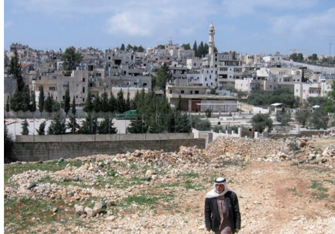
Bethléem, 2007. Un Palestinien sort du camp de réfugiés d'Aïda.

Les habitants palestiniens de Jérusalem-Est (soit 230 000 personnes) ont un statut à part. Cette partie de la ville a été non seulement occupée, mais annexée par Israël après 1967. Les Palestiniens de Jérusalem reçoivent depuis une « carte de résident » qui leur accorde le droit de rester vivre dans leur ville. De plus en plus difficile à faire renouveler et révoquant, cette carte ne leur garantit pas non plus l'accès aux mêmes droits ni aux mêmes services publics qu'aux autres habitants israéliens. ■