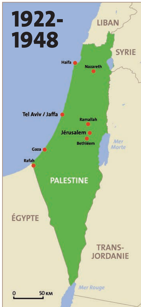
Carte de la Palestine sous mandat britannique de 1922 à 1948.