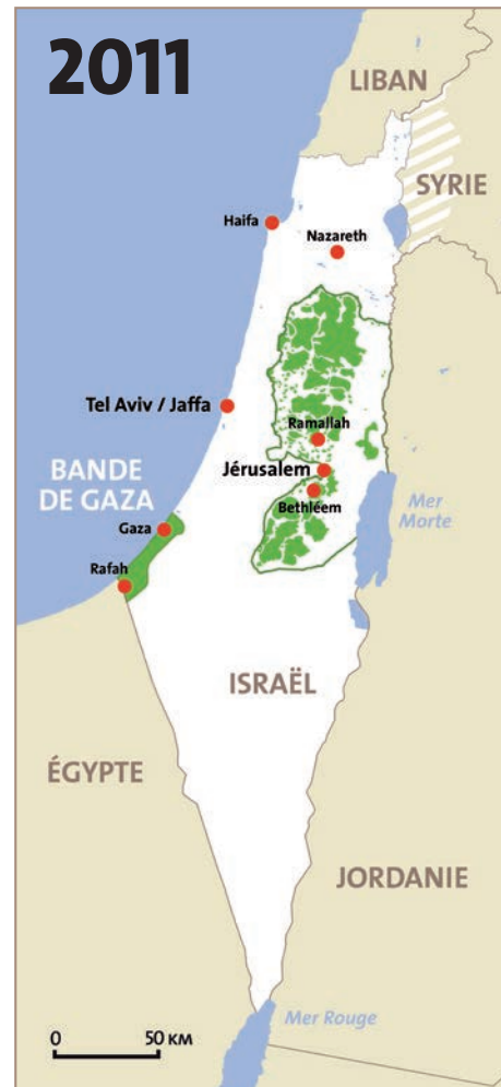
En 2011, les colonies et leurs infrastructures occupent plus de 43 % de la Cisjordanie.