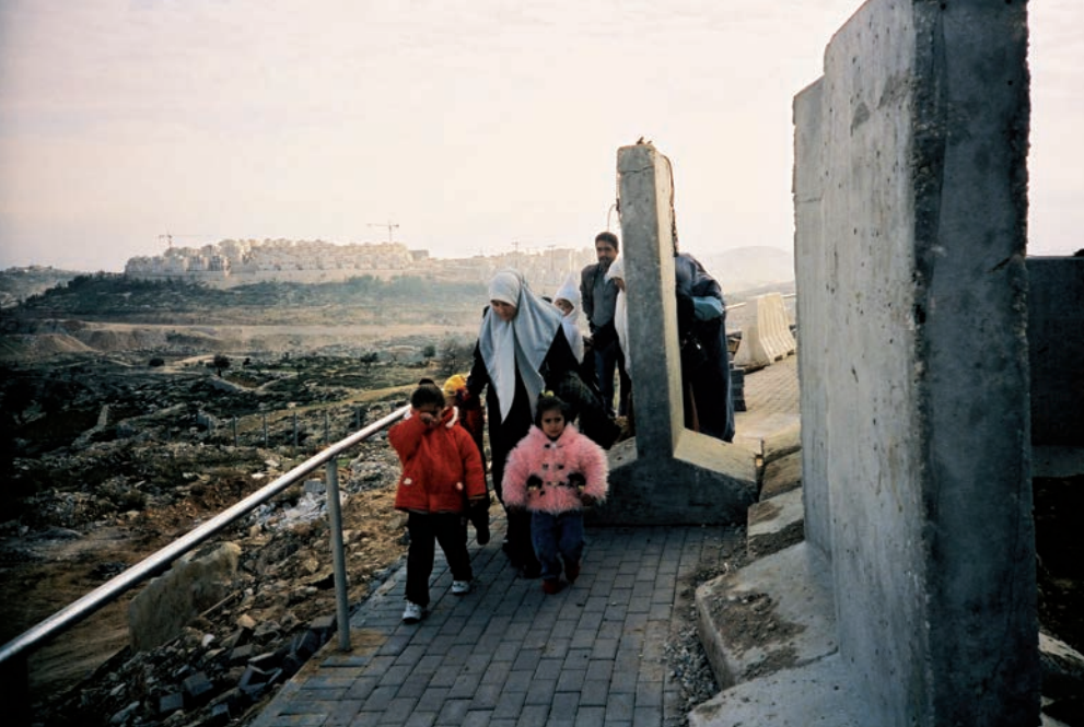
Bethléem, 2001 Check-point de Tantur à Bethléem. Au second plan, la colonie de Har-Homa, le 31 décembre 2001. Chaque jour, des milliers de Palestiniens doivent franchir les barrages et contrôles militaires israéliens des territoires occupés (« check-points »).