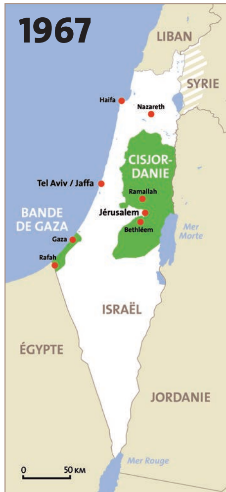
En 1967, suite à la guerre des Six jours, Israël occupe la Cisjordanie, dont Jérusalem-Est, la bande de Gaza, le Golan syrien et le Sinai égyptien. Seul le Sinai égyptien sera restitué suite aux accords de paix de Camp David (1978).