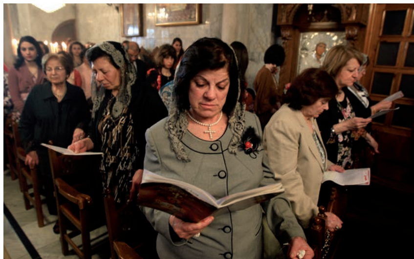
Ville de Gaza, avril 2012. Des catholiques palestiniens assistent à la veillée pascale et célèbrent la résurrection du Christ.