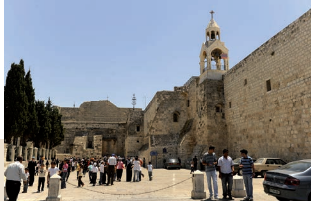
Basilique de la Nativité, Bethléem , lors du pèlerinage « Aux Sources – Terre Sainte 2009 », 28 Juillet 2009.

Kairos est un mot grec désignant le temps . Contrairement à chronos qui désigne le temps ordinaire ou chronologique, kairos désigne le temps sacré ou donné par Dieu, le temps de l'occasion opportune pour se repentir et le temps du renouveau : « Maintenant est le bon moment pour agir. » Reconnaître le kairos signifie reconnaître que c'est maintenant le temps d'agir pour la justice.