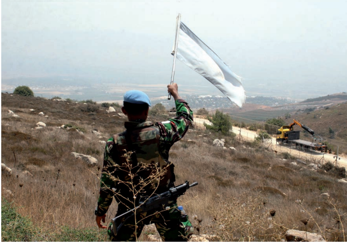
Finul. Un soldat servant dans la Force intérimaire des Nations unies au Liban (FINUL) tente de calmer la situation à la frontière libano-Israélienne, le 3 août 2010.