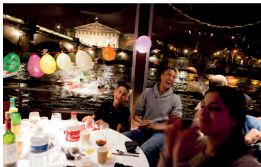
D. METRA / SC-CF

« P articiper à cette fête multiculturelle sur les péniches de Paris, chaque réveillon du 24 décembre, est pour moi un moment "sacré", une occasion d'échanges avec d'autres personnes que je n'aurais sans cela jamais rencontrées. Et pour rien au monde je ne manquerais ce moment de partage et de joie. Fidèle à ce rendez-vous depuis plus de dix ans, j'ai plaisir à retrouver d'une année sur l'autre l'équipe de bénévoles qui assure le bon déroulement de la soirée de Noël sur cinq péniches qui promènent durant une heure et demie quelque 500 personnes. Celles-ci sont accompagnées tout au long de l'année par les bénévoles du Secours Catholique et par l'Association des Cités du Secours Catholique (ACSC). Sur l'une des cinq péniches, je coordonne les interventions de tous : l'équipe de bénévoles, le traiteur, les musiciens, et bien sûr l'accueil de nos convives et leurs enfants. Je suis