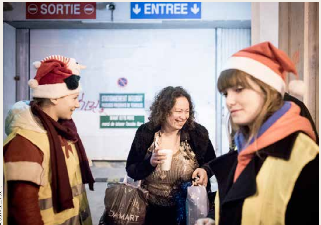
X. SCHWEBEL / S.C.-C.F.