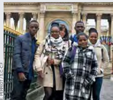
E. PERRIOT / S.C.C.F.

M gr Emmanuel Lafont, évêque de Cayenne, lors d'une récente interview au journal La Croix . Le mayouri est un mot d'origine amérindienne qui désigne la solidarité entre parents, voisins et habitants d'une même localité pour effectuer un travail d'intérêt collectif.