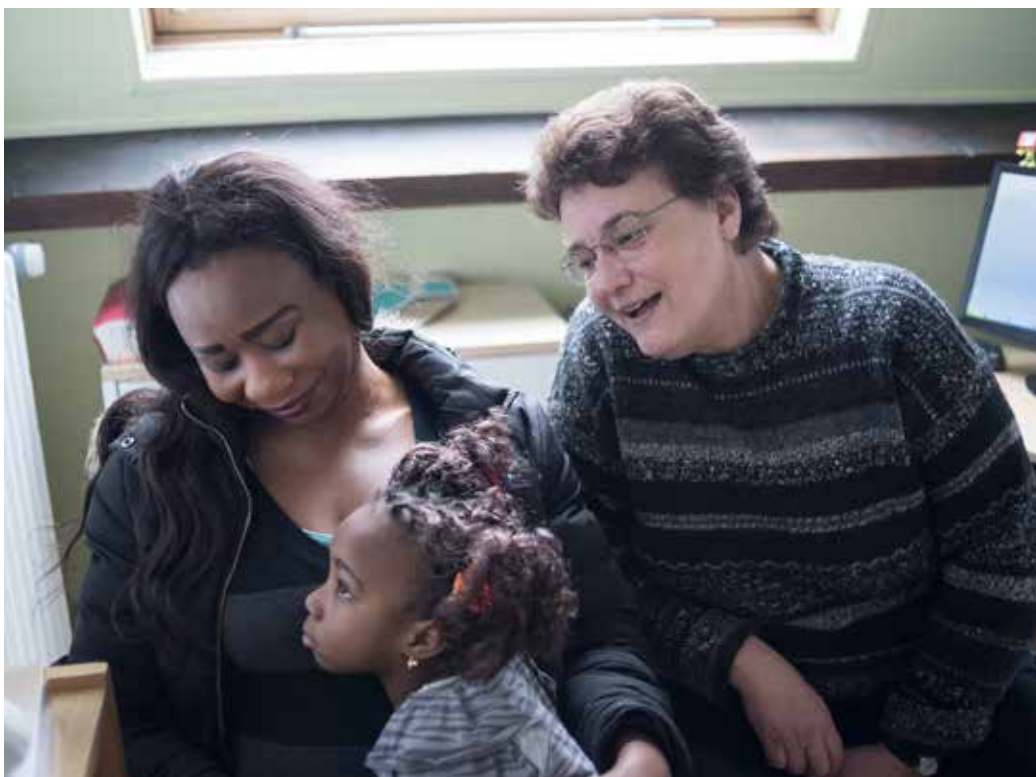
X. SCHWIBEL / S.C.-C.F.

La fatigue émotionnelle et physique des mères par Violaine Guéritault, éditions Odile Jacob, 2008.