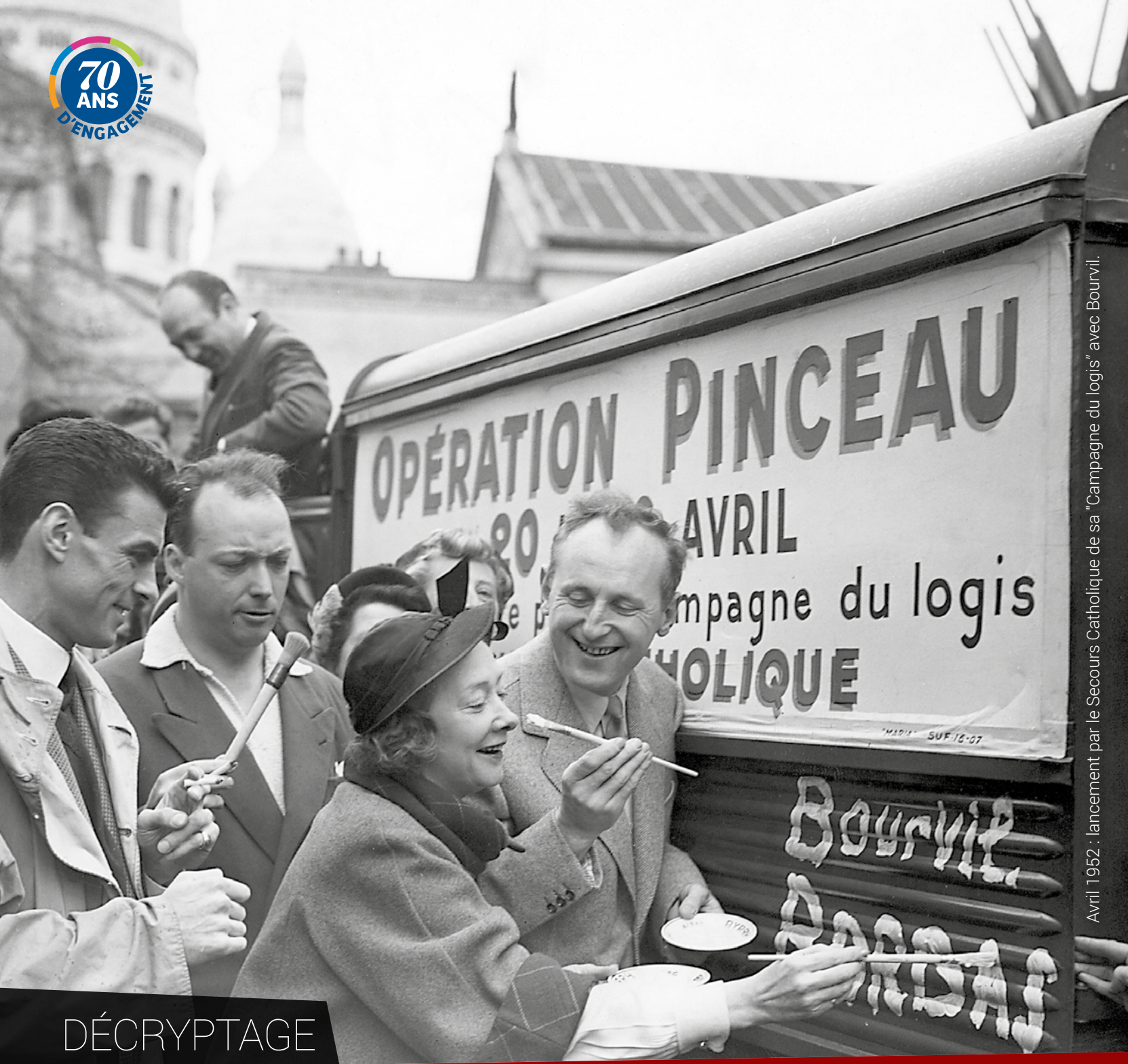
Avril 1952 : lancement par le Secours Catholique de sa "Campagne du logis" avec Bourvil.