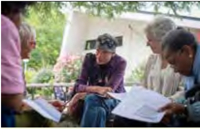
E. PERRIOT / SC-CF