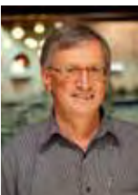
E. PERRIOT / SC-CF

Cette parabole fait partie des paraboles de la Miséricorde, elle est souvent commentée et méditée. La méthode utilisée ici permet de se mettre dans la peau des personnages. Nous faisons des découvertes : ainsi le personnage de la monture du Samaritain : « il le chargea sur sa propre monture ». Cette parole passe habituellement inaperçue. Pourtant elle est riche d'enseignements, comme la nécessité de travailler en réseau, ce que souligne le groupe. Je me souviens d'un partage avec des animateurs du Secours Catholique sur cette parabole. À ma grande surprise, une jeune femme nous dit : « Moi, je m'identifie à la monture du Samaritain, pour moi c'est le rôle du Secours Catholique, nous ne sauvons pas les gens, nous sommes un maillon d'une chaîne de solidarité et de fraternité jusqu'à l'auberge. » J'ai découvert ensuite que cette jeune femme n'était pas croyante. Cela confirme le fait que les non-chrétiens peuvent aider à découvrir dans les Évangiles des significations inattendues.