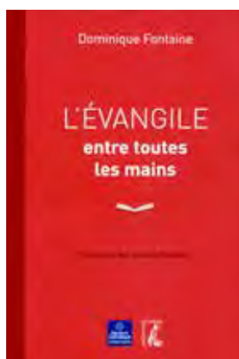
Dominique Fontaine, L'Évangile entre toutes les mains , Éditions de L'Atelier, 2016.