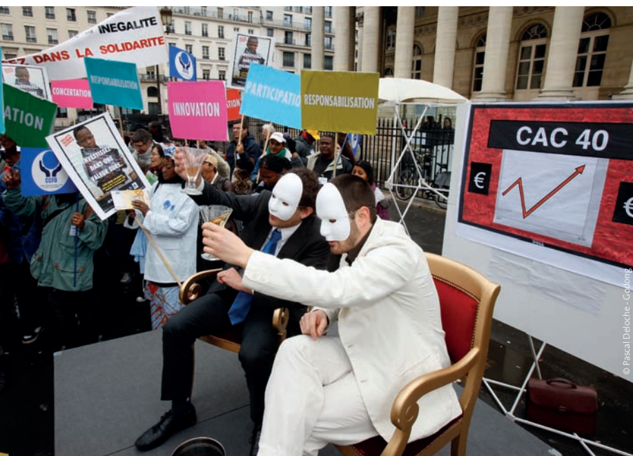
Mars 2009, place de la Bourse à Paris, opération menée par le CCFD-Terre Solidaire dans le cadre de la campagne « Investissez dans une valeur sûre ».

F ace à la complexité et l'ampleur des phénomènes décrits, les citoyens se sentent souvent résignés et démunis. Pourtant, en plus du vote, il est possible d'agir à plusieurs niveaux :